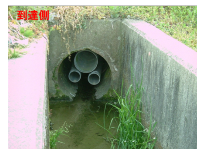
■ 既設陶管の埋設状況